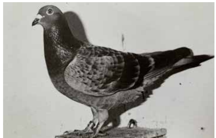
Deze jonge schalie doffer was in 1967 de snelste Orléansvlieger van het land.